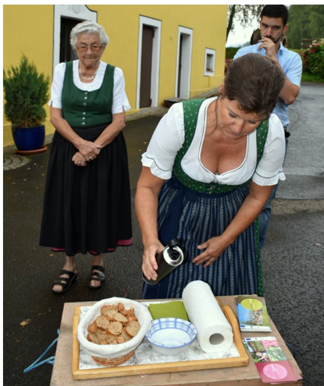
Příprava ochutnávky dýňového oleje na regionálním statku Haffelner