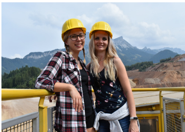
Holky z MASKy