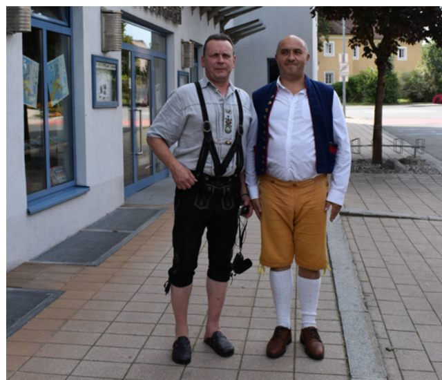
V letošním roce se dva z našich partnerů ujali tematického oblečení