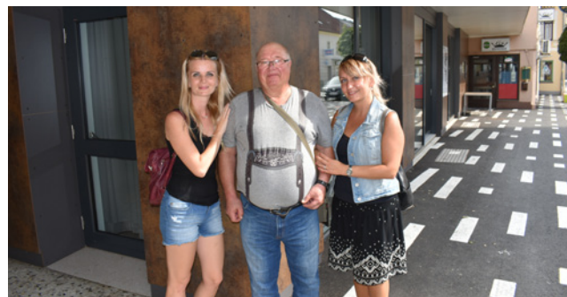
Návštěva města Trofaiach