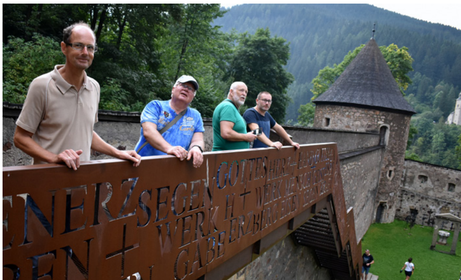
Vyhliďkový ochoz u Kirchenburg St. Oswaldi (vlevo zástupce spřátelené rakouské MAS)