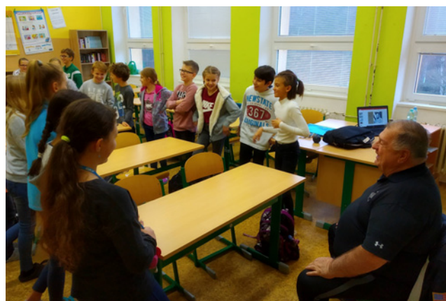
Hodina angličtiny s rodilým mluvčím

Pozvánky a zajímavosti zveřejňujeme také na facebooku projektu: https://www.facebook.com/MAPKarlovaskoll/