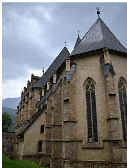
Kirchenburg St. Oswaldi