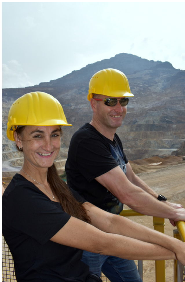
Každý měl povinnost na Haullym mít helmu