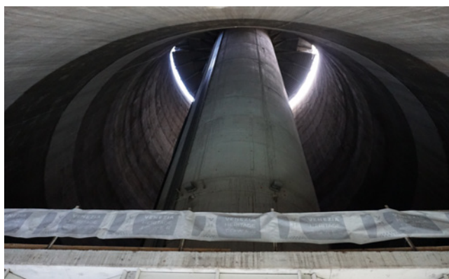
Benátská věž dědictví/Venezia Heritage Tower

Projekt InduCCI je realizován od 1. 4. 2019, zahajovací setkání mezinárodního projektového týmu proběhlo 17. 6. 2019 - 19. 6. 2019 v Padově v Itálii. Zástupci regionů objevovali společné výzvy spojené s kulturním a kreativním průmyslem a prezentovali příklady dobré praxe. Italský partner představil např. start-up na podporu začínajících kreativních podnikatelů a Benátskou věž dědictví (Venezia Heritage Tower). Ve zmíněném start-upu byla například vyvíjena myšlenka vzniku nové autobusové buňky bez řidiče, která se dokáže připojovat k dalším buňkám a odpojuje se v závislosti na počtu cestujících a celkové hustotě přepravy.