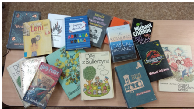
Členové pracovní skupiny čtenářská gramotnost se bavili o inspirativních knížkách z dětství i z dospělosti

na webových stránkách projektu. Údaje jsou anonymizovány tak, abychom netvořili žebříčky škol a někoho nepoškodili. Protože z rozhovorů vyplynuly některé dotazy, které členové realizačního týmu neuměli zodpovědět, obrátili jsme se na Českou školní inspekci. Dokument tak obsahuje i doporučení České školní inspekce, která mohou využít ředitelé škol. Dokument je dostupný na webu MAP Karlovarsko II: http://mas-sokolovsko.eu/projekty/aktualni/map-karlovarsko-ii/