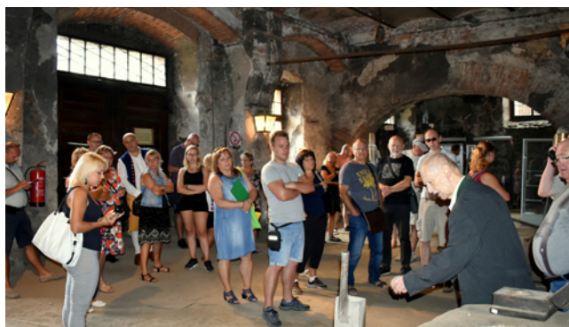
Návštěva muzea v obci Vordernberg