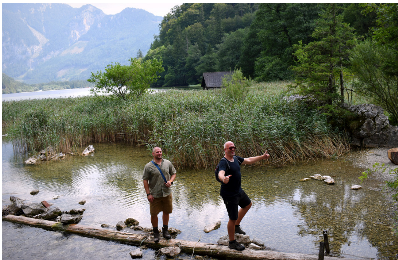
Dva z partnerů MAS Sokolovsko