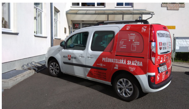
Automobil pro sociální služby města Rotava

Všechny projekty z výzev z roku 2017 jsou již dokončeny a vyúčtovány, což naši MAS řadí mezi ty místní akční skupiny, které úspěšně čerpají v rámci IROP a plní ukazatele stanovené Ministerstvem pro místní rozvoj. Projekty z roku 2018 budou průběžně vyúčtovávat na konci letošního a v průběhu příštího roku. V tomto článku přinášíme fotodokumentaci ze čtyř dokončených projektů.