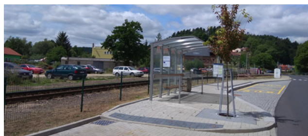
Autobusová zastávka jako součást terminálu v Lokti