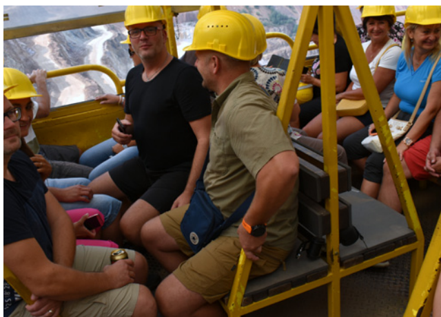
Haully – Erzberg