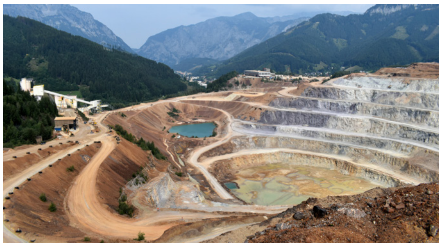
Vyhlička do lomu Erzberg