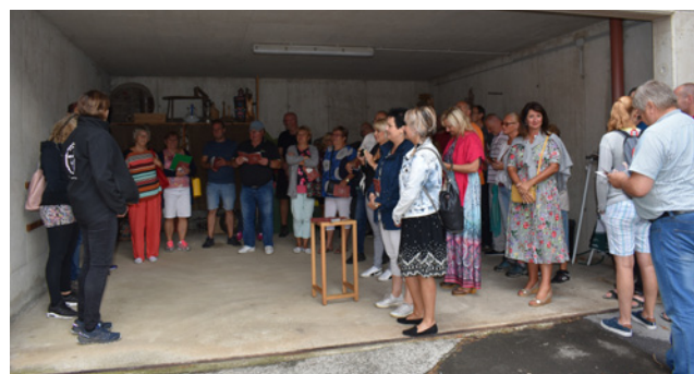
Návštěva druhého regionální statku Lanzer