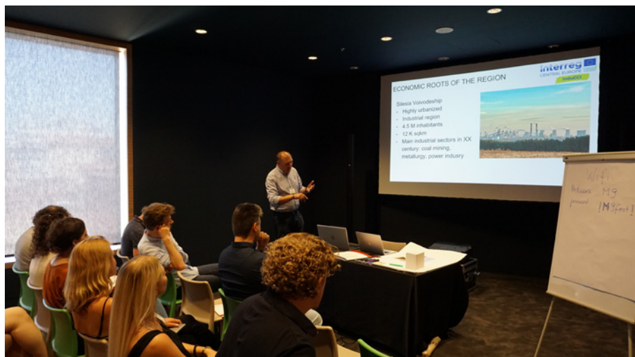
Sdílení zkušeností a dobré praxe mezi partnery projektu