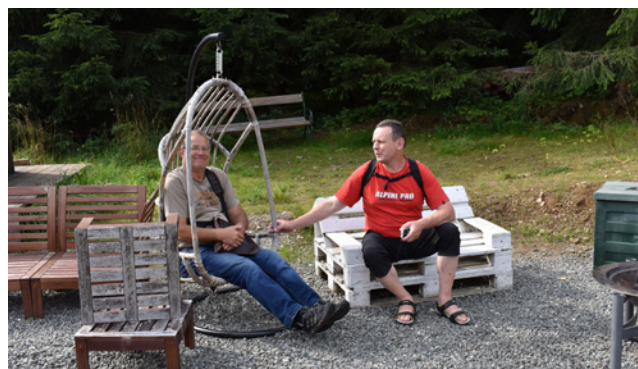
Chvilka odpočinku u Vordernberg