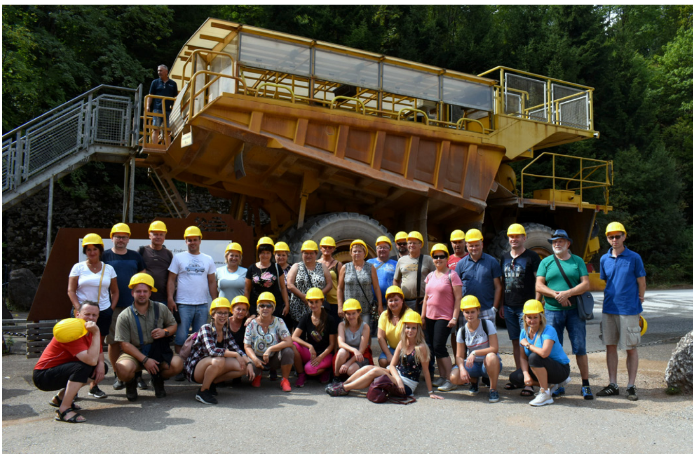
Celá delegace u Haullyho