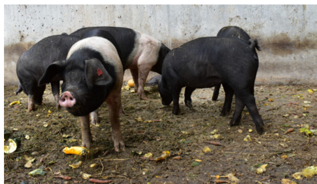
Zvířata statku Lanzer