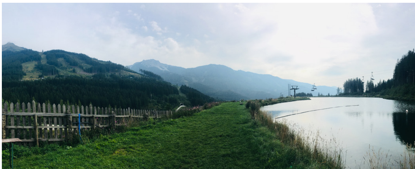
Výhled u sportovního areálu u Vordernberg