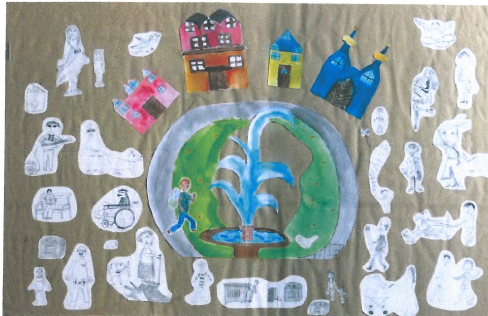
Obr. č. 1: Ilustrace k vizi

Chceme, aby Karlovarsko bylo místem příležitostí.