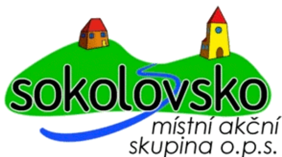
Finální verze loga z r. 2007.