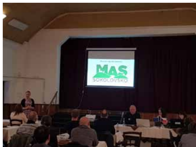
Foto Valná hromada partnerů 17. 1. 2019 – volba nového loga.

Ale, jak se říká, změna je život, aneb nic netrvá věčně. A tak jsme v závěru roku 2018 rozjeli kampaň s cílem zjistit, zda naše logo je stále ještě dostatečně přitažlivé, nebo zda již nastal čas na jeho obměnu. Prostřednictvím internetové aukce jsme spustili veřejnou soutěž na návrh nového loga. Návrhů jsme obdrželi téměř 30 a některé byly velmi povedené. A protože jsme si nedokázali technicky představit, jak z takového množství na Valné hromadě partnerů MASKy vybíráme to nejhezčí, hlasovali jsme v rámci zaměstnanců, a to jedno vítězné, jsme poslali „do boje“ s logem původním. Členové Valné hromady partnerů MAS tak v Krásné dne 17. 1. 2019, tj. téměř po 12 letech, opět rozhodovali o budoucím vzhledu našeho loga. Jak to dopadlo?