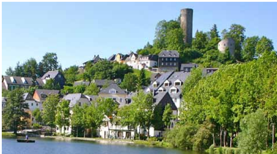
Bad Lobenstein, Zdroj: www.thueringen-entdecken.de