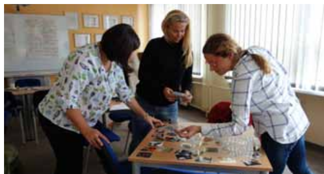
Z jednání pracovní skupiny k výuce angličtiny

jet do Bečovské botanické zahrady, na Kladskou či do Kláštera premonstrátů v Teplé.