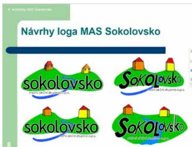
První návrhy loga MAS Sokolovsko.

Dodnes vidím živě před očima, jak jsme 23. ledna 2007 v Kaceřově v rámci 6. workshopu u příležitosti přípravy strategie MAS Sokolovsko na období 2007-2013 schvalovali podobu loga MASKy. Dokonce mám dodnes prezentaci s návrhy loga uloženou v počítači (viz obrázek níže).