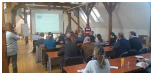
Fotografie z úvodního setkání k projektu, Statek Bernard, 15. 4. 2019