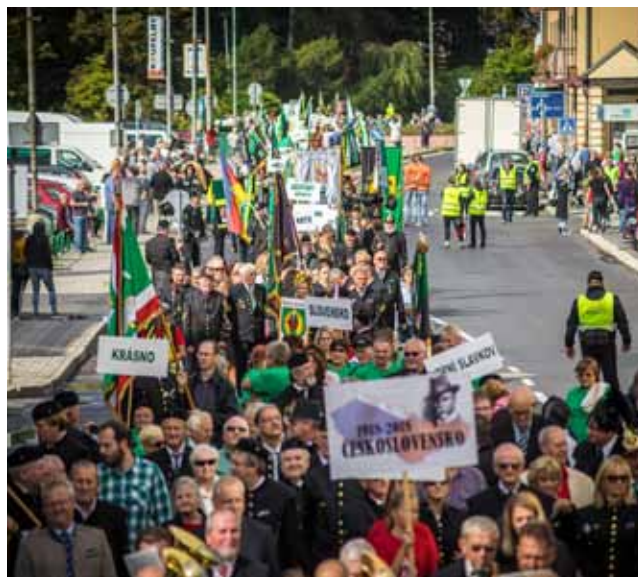
Hornický průvod spolufinancovaný z projektu InduCult2.0