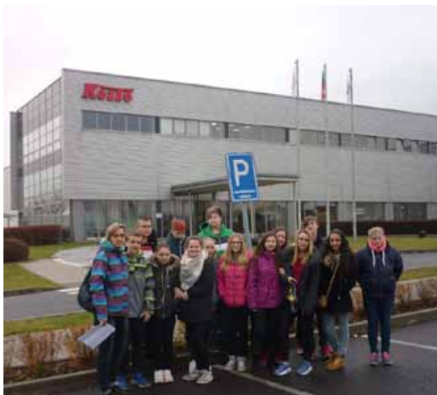
Exkurze dětí ve firmě Koito Czech, s.r.o.