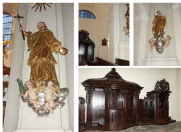
Restaurované vybrané části mobiliáře poutního kostela Nanebevzetí Panny Marie v Chlumu sv. Maří

Dále bychom chtěli informovat, že ačkoliv jsou v IROP v CLLD MAS Sokolovsko v plánu už jen tzv. zbytkové výzvy, je již v přípravě nové programové období. V IROP se i v dalším programovém období nadále počítá s komunitně vedeným místním rozvojem. Mezi navrhované oblasti podpory v IROP patří: doprava, infrastruktura pro vzdělávání, sociální bydlení, infrastruktura sociálních a zdra-