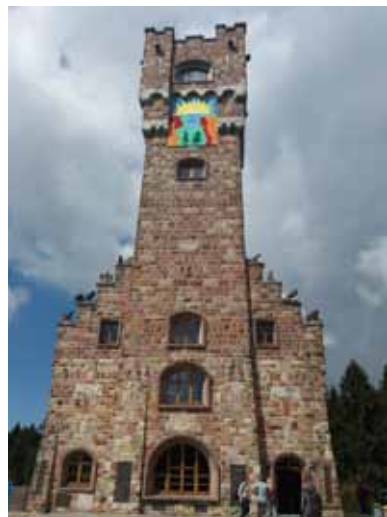
Altvaterturm Lehensten