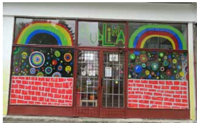
Nízkoprahové zařízení NZDM Michal, realizované z 1. výzvy CLLD OP Z MAS Sokolovsko