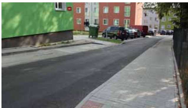
Chodník v ulici Dlouhá v Horním Slavkově

votních služeb, podpora veřejné infrastruktury cestovního ruchu a kulturního dědictví, zkvalitnění veřejných prostranství v obcích včetně zelené infrastruktury, revitalizace brownfieldů, ochrana obyvatelstva a prevence rizik, rozvoj inovačních aktivit ve vazbě na podporu podnikání a trh práce. Upozorňujeme čtenáře, že se jedná o návrh zaměřený oblastí podpory ze strany ŘO IROP, následovat budou další a další kola vyjednávání a až poté budou známa přesná pravidla. Nicméně dle hesla „připravenému štěstí přeje“ doporučujeme již nyní začít přemýšlet nad prioritami obcí a připravovat projektové dokumentace, stavební povolení atd.