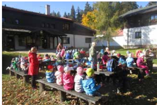
Děti z MŠ Žlutice na Kladské v rámci aktivity Putování krajem živých vod