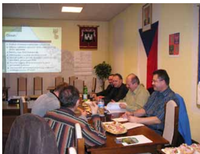
Foto z workshopu 23. 1. 2007 – volba loga.

O logu jsme tenkrát hlasovali a po drobných připomínkách jsme zvolili logo, které úžasně navazovalo na naši vizi. Ta zní: „Změníme Sokolovsko ve skutečný domov obrozením duše a krajiny.“