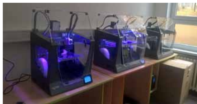
3D tiskárny v ZŠ Bukovany