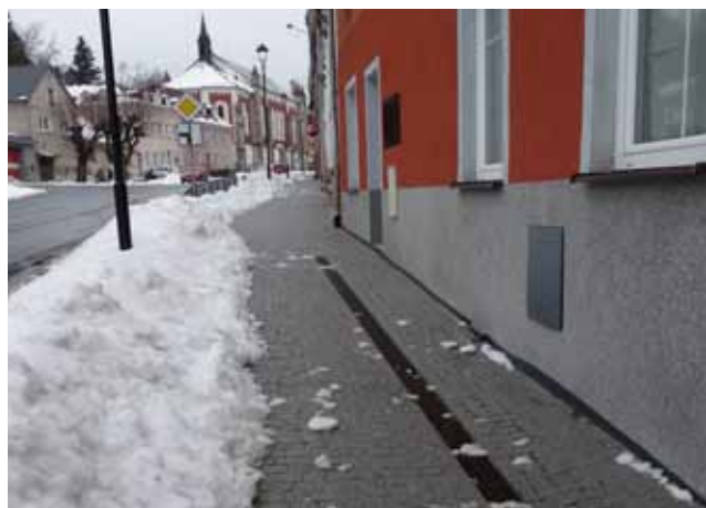
Chodník v Krásné

votních služeb, podpora veřejné infrastruktury cestovního ruchu a kulturního dědictví, zkvalitnění veřejných prostranství v obcích včetně zelené infrastruktury, revitalizace brownfieldů, ochrana obyvatelstva a prevence rizik, rozvoj inovačních aktivit ve vazbě na podporu podnikání a trh práce. Upozorňujeme čtenáře, že se jedná o návrh zaměřený oblastí podpory ze strany ŘO IROP, následovat budou další a další kola vyjednávání a až poté budou známa přesná pravidla. Nicméně dle hesla „připravenému štěstí přeje“ doporučujeme již nyní začít přemýšlet nad prioritami obcí a připravovat projektové dokumentace, stavební povolení atd.