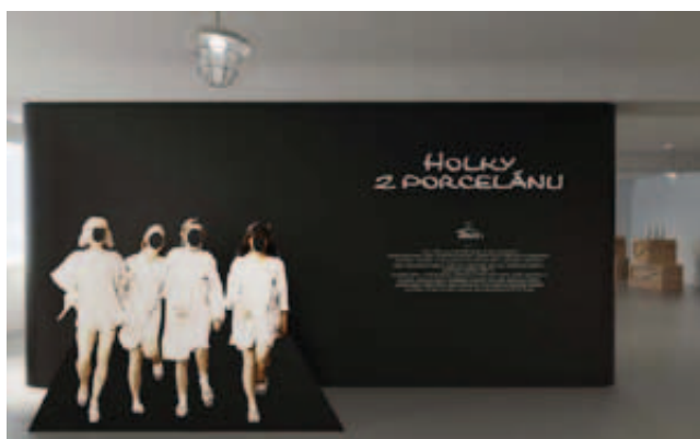
Návrh konceptu návštěvnického centra v Klášterci nad ohří