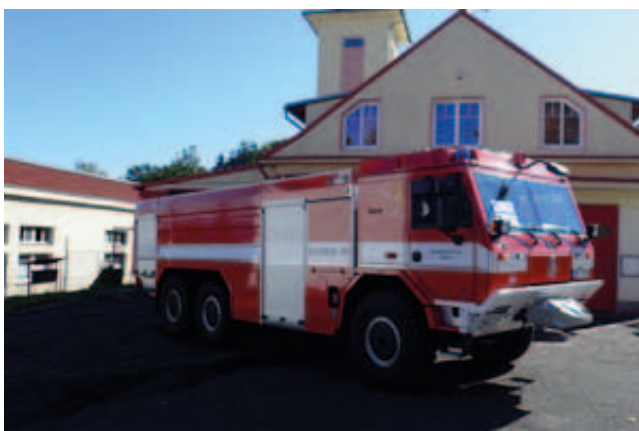
Hasičská cisterna jednotky požární ochrany Březová