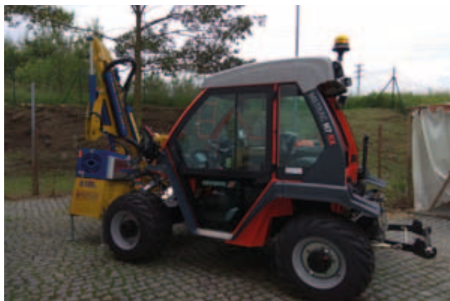
Horský traktor pro sociální podnikání společnosti ABRI