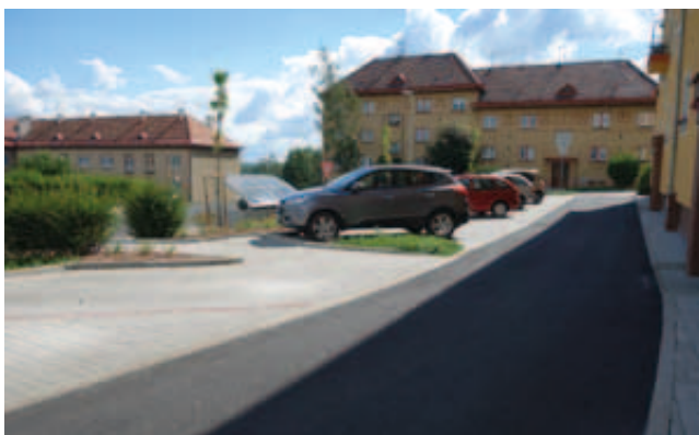
Projekt bezpečné dopravy v městě Březová