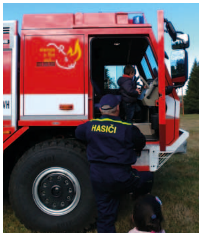
Malý budoucí hasič v Rovné si nenechal ujít prohlídku kabiny