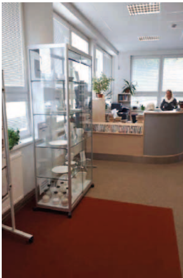
Návrh konceptu návštěvnického centra v Klášterci nad ohří