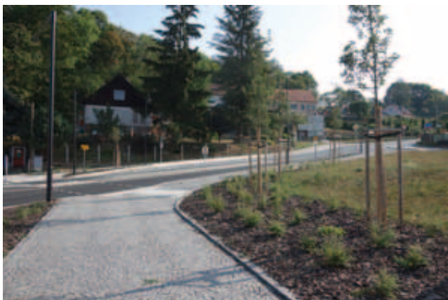
Jeden ze tří projektů na rekonstrukci chodníků v Horním Slavkově