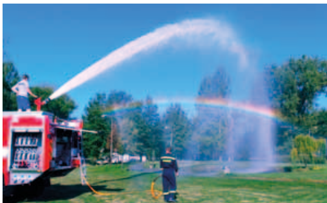
Díky slunečnému počasí se hasičům povedla v Dolním Rychnově krásná duha