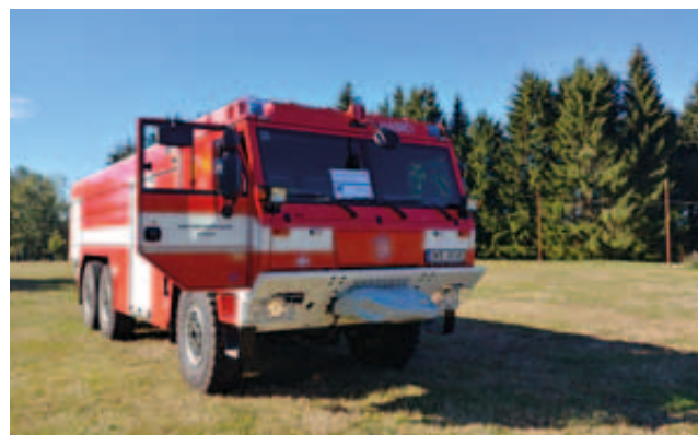
Cisterna se na Rovné ukázala v celé své kráse