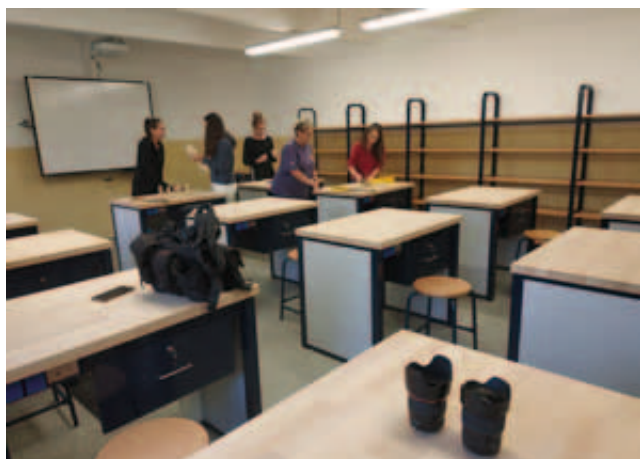
Rekonstruovaná učebna v ZŠ Nové Sedlo