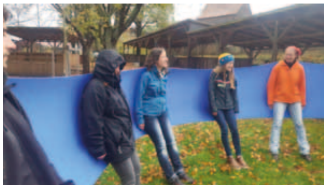
Trénink týmové koordinace

Doba realizace projektu: 1. 2. 2018 – 31. 1. 2021