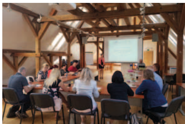
Seminář k šablonám II – květen 2018

Žádost o podporu mohou podávat mateřské a základní školy. Nově mohou žádost o podporu podávat také základní umělecké školy a školská zařízení pro zájmové vzdělávání.