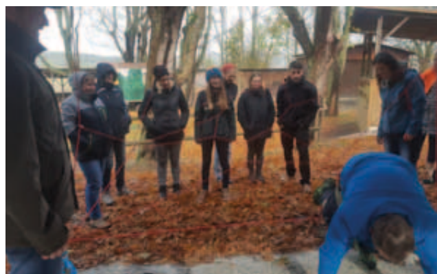
Prolézání „pavoučí sítě“