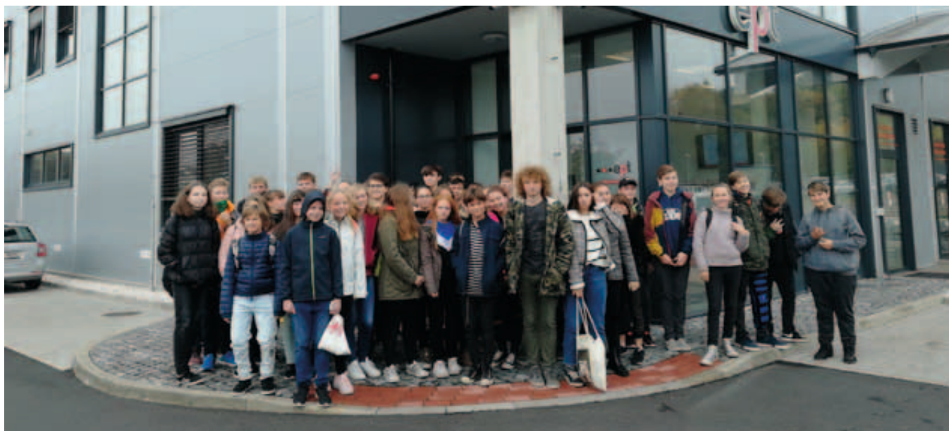
Exkurze žáků ZŠ K Vary Poštovní v ept connector v Habartově