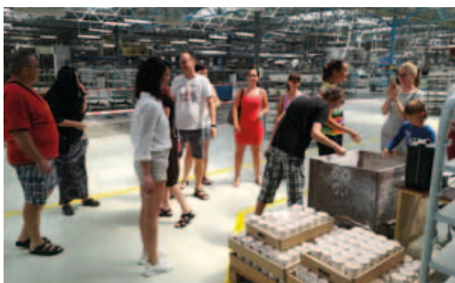
Exkurze v porcelánci Thun 1794 v Nové Roli