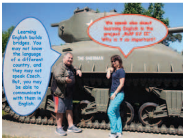
Ilustrace k tématu výuky angličtiny