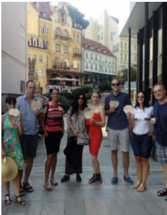
Prohlídka Karlových Varů