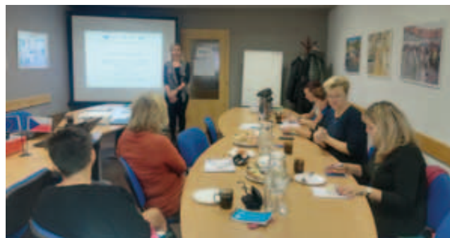
Seminář k šablonám II – listopad 2018