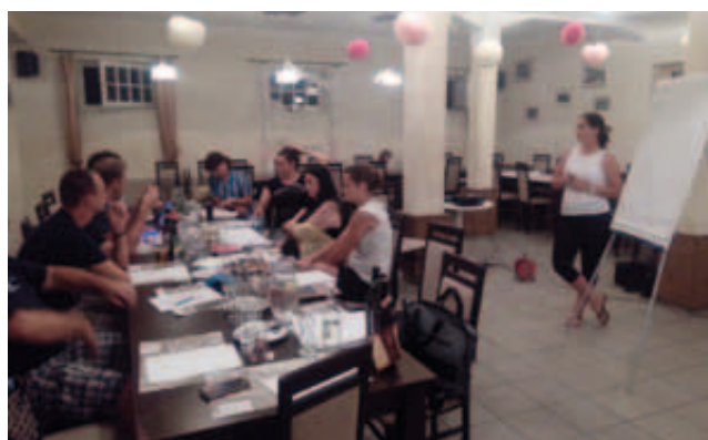
Co děláte o tropické noci? Svou práci...