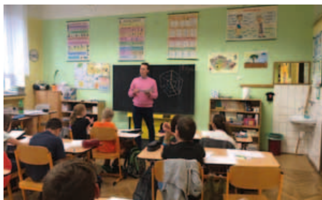
Aktivita „Paměť a efektivní učení“ v ZŠ a MŠ Chyše