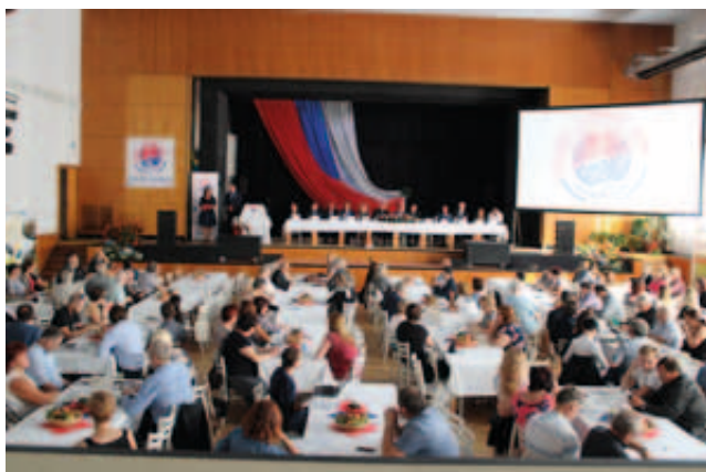
Plenární zasedání Národní konference Venkov