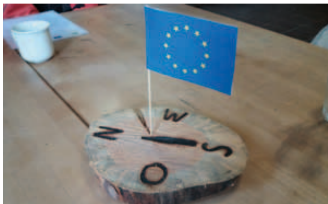
Originální pojetí povinné publicity

Máte-li zájem se k nám připojit, budete mít možnost na jaře a na podzim příštího roku, kdy budou další odborné workshopy. Všichni zájemci o environmentální vzdělávání jsou srdečně vítáni.