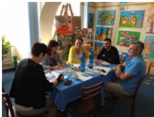
Schůzka projektového týmu v Toužimi