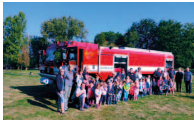
V dolnorychnovském parku se nakonec všichni společně vyfotili.