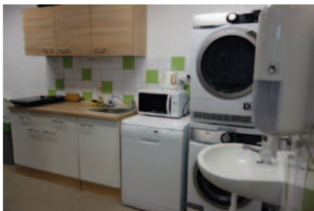
Nízkoprahové denní centrum v Sokolově