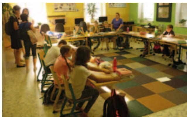
Aktivita „Přístupy k vedení třídnických hodin“ v ZŠ a MŠ Božičany

angličtiny a také možnost praktického tréninku angličtiny přímo s rodilým mluvčím jako přínosné a bylo tedy domluveno, že budeme v rámci projektu „MAP Karlovarsko II“ pokračovat v pravidelných setkáních i nadále.