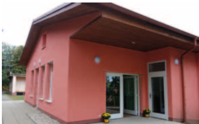
Nově vybudovaný pavilon MŠ Duhová v Habartově