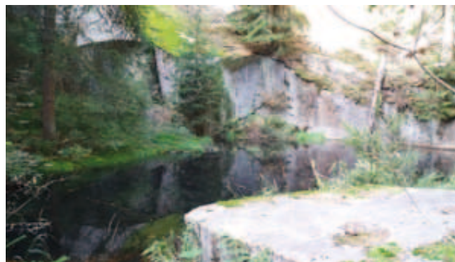
Objevujeme malebná zákoutí přírody