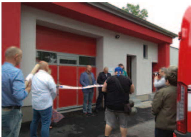
Slavnostní otevření rekonstruované hasičské zbrojnice v Habartově