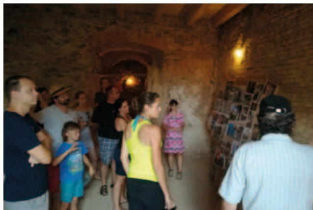
Povídání o historii hradu Hartenberg