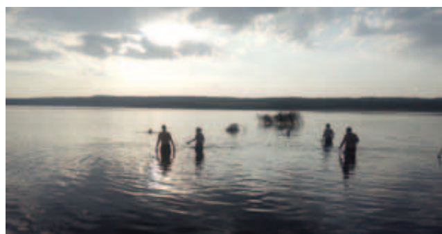
Koupání v Medardu