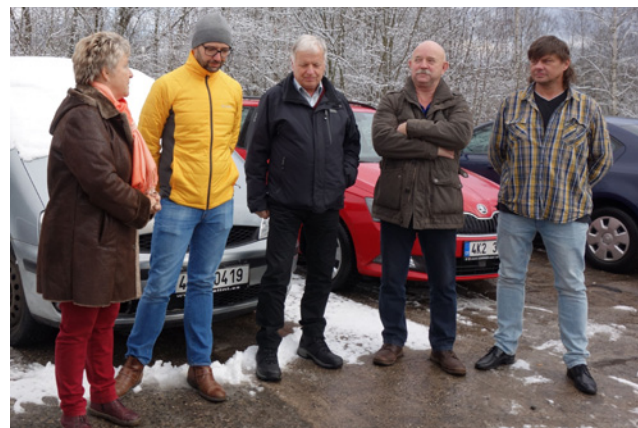
Slavnostní otevření rekonstrukce chodníku v Novém Sedle

Nejvíce projektů bylo loni zaměřeno na bezpečnou dopravu. Podívejme