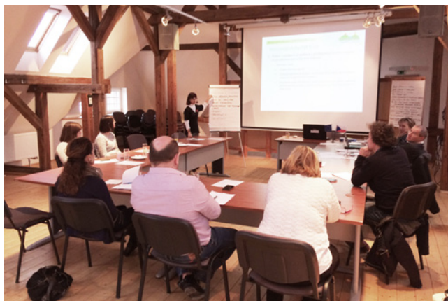
Seminář pro žadatele v programovém rámci IROP

Další projekty z výzev z roku jsou zaměřeny například na infrastrukturu a vybavení škol, vybudování zázemí pro jednotku požární ochrany, stavbu přestupního terminálu, vybudování parkovacího systému, pořízení automobilu pro sociální služby, obnovu památek a infrastrukturu pro sociální podnikání. Zde je jeden z příběhů projektu zaměřeného na sociální infrastrukturu. V polovině roku 2016 nabylo město Sokolov do vlastnictví budovu č. p. 2140 v Nádražní ulici, Sokolov. Na náklady města byla provedena rekonstrukce 2. nadzemního podlaží této budovy, kde je od konce roku 2016 provozována sociální služba – noclehárna. Začátkem roku 2017 zahájilo město přípravy vedoucí k rekonstrukci zbylého 1. nadzemního podlaží této budovy. Zde je v plánu zahájit provoz další registrované sociální služby – nízkoprahové denní centrum. V dubnu 2017 podalo město Sokolov žádost o podporu do výzvy „MAS Sokolovsko – IROP – Zvýšení kvality a dostupnosti služeb a opatření vedoucí k sociální inkluzi“ na projekt „Rekonstrukce budovy č. p. 2140 v Nádražní ulici, Sokolov – nízkoprahové denní centrum“. V prosinci 2017 žádost o podporu splnila podmínky k financování. Rozhodnutí o poskytnutí dotace obdrželo město Sokolov začátkem března 2018. Termín zahájení provozu registrované sociální služby včetně navýšení kapacity této služby je od 16. 9. 2018.