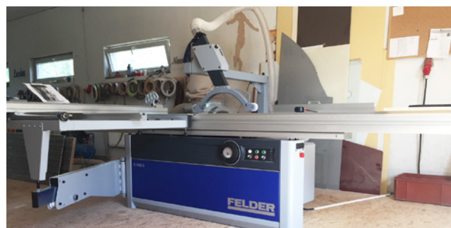
Formátovací pila pořízená díky dotaci z PRV přes MAS Sokolovsko - jedná se o 1. úspěšně ukončený projekt 1. výzvy PRV