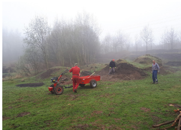
Zaměstnanci sociálního podniku v pracovním nasazení.

Průběžně dochází k vybavování sociálního podniku drobným majetkem, kterým je např. zahradní traktor, křovinořezy, motorové pily, ochranné pomůcky atd. Nejvíce ale sociální podnik očekává dodávku svahového horského nosiče, který je klíčovým prvkem fungování podniku. Tento je spolufinancován z IROPu a jeho dodávka je plánována na konec května.