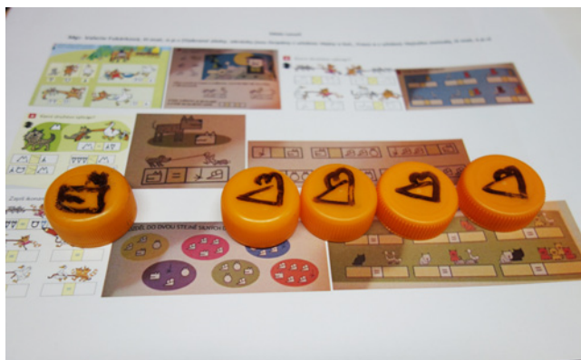
Ukázka výpočtů v prostředí „Děda Lesoň“ v Hejného matematice