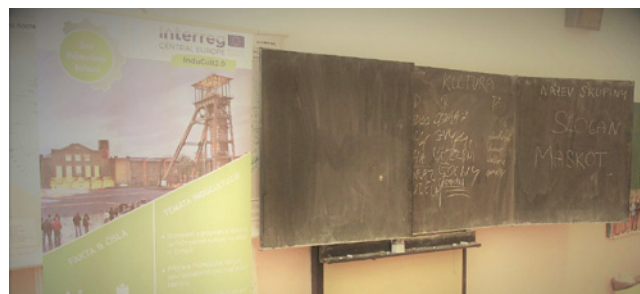
Projekt InduCult2.0 ve školní třídě