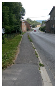
Chodník v Novém Sedle - původní stav

se na příběh jednoho z nich. Město Nové Sedlo má již hotový projekt do výzvy č. 1 IROP. Město podalo dne 8. 3. 2017 žádost o podporu na investiční akci „Chodník a veřejné osvětlení podél silnice II/209 z Chránišova do Chodova“. Požadovaná výše dotace byla 2,5 mil. Kč. Rozpočtované náklady činily 6,3 mil. Kč bez DPH. Skutečné náklady byla pak kolem 4,5 mil. Kč. Rozdíl mezi dotací a náklady hradilo město z vlastních zdrojů. Stavba byla zahájena 6. 6. 2017 a dokončena 20. 10. 2017. Práce prováděla firma Vodohospodářské stavby spol. s r.o. Teplice. Byl postaven nový chodník od autobusové zastávky v Chránišově po pravé straně do Chodova a po levé straně část chodníku (až ke kadeřnictví v Chránišově). Bylo také vybudováno nové veřejné osvětlení s LED svítidly, vyměněn vodovod a dešťová kanalizace, jednotlivé nemovitosti byly přepojeny na tyto sítě. Dále bylo vybudováno místo pro přecházení. Před loňskými Vánoci pak proběhlo slavnostní otevření rekonstruovaného chodníku.