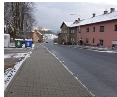
Chodník v Novém Sedle - stav po rekonstrukci