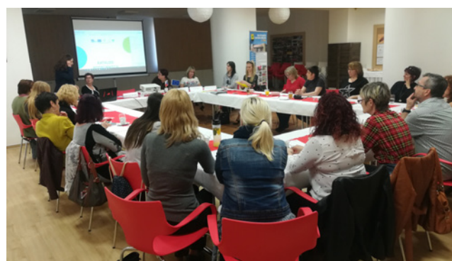
Dne 10. 4. 2018 se konal kulatý stůl s názvem „Podpůrná opatření od A do Z“, jehož se účastnilo na 20 zástupců škol z území ORP Sokolov a ORP Kraslice.