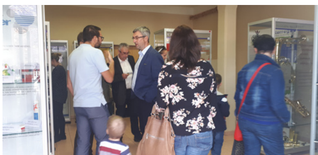
Vernisáž Putovní výstavy Průmysl se představuje veřejnosti na Statku Bernard v Královském Poříčí dne 17.4.2018