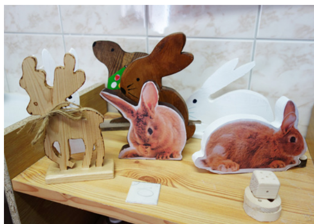
Inspirace – výrobky žáků ZŠ a ZUŠ Karlovy Vary Šmeralova

Během jednání pracovních skupin plánujeme další zajímavé a potřebné vzdělávací aktivity na další měsíce a roky projektu.