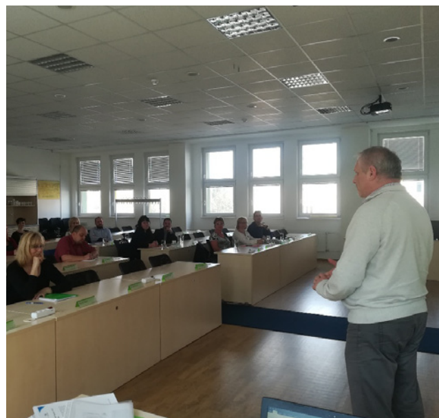
Jednání Řídícího výboru MAP SOKRA 11. 4. 2018 na MÚ Sokolov