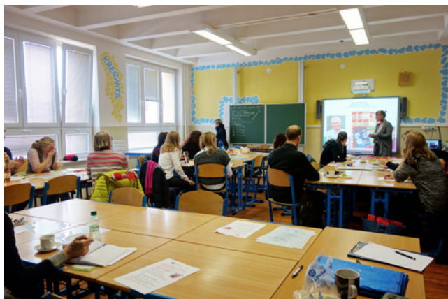
Workshop Hejného matematika

torky je důležité, že první žáci vzdělávání dle této alternativní metody jsou již ve věku, kdy sami dokáží zhodnotit přínosy tohoto způsobu výuky. Podle jejich slov nelze říci, že Hejného matematika je zázračným nástrojem. Jsou děti, které mají přirozeně větší nadání pro matematiku a logiku. Jiné děti by měly s matematikou problémy při běžné výuce i při výuce Hejného matematikou. Výhodou Hejného matematiky je podle lektorky to, že umožňuje řešit jeden příklad různými způsoby a nevyvolává v dětech odpor k matematice. Pokud bude dostatečný zájem ze strany pedagogických pracovníků, v rámci projektu MAP Karlovarsko II, můžeme uspořádat pokročilejší seminář k této metodě výuky. Vzhledem ke špatným výsledkům žáků Karlovarského kraje v matematické gramotnosti, je povzbuzující, že učitelé jsou otevření hledání možností k řešení tohoto problému. Není rozhodující, zda použijí Hejného matematiku či tradiční metody.