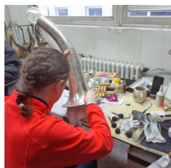
Exkurze dětí ve firmě Amati-Denak, s.r.o. - zkouška rytí do tuby