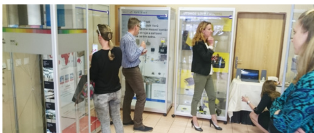
Vernisáž Putovní výstavy