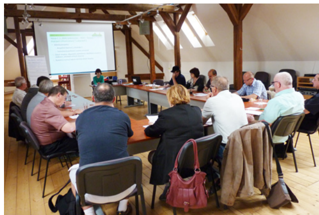
Jednání Výběrové komise