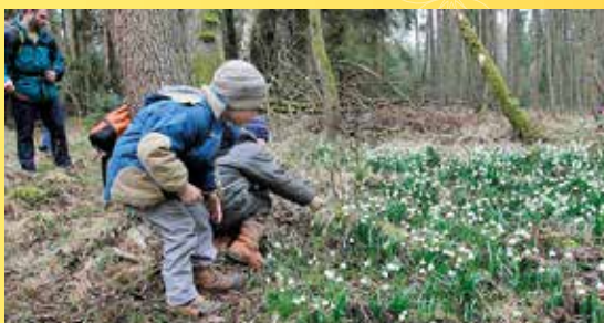
Za bledulemi a jinými krásami PR Petrovka 2015.

Poznámka: Obuv a oblečení do terénu. Dalekohled vítán.