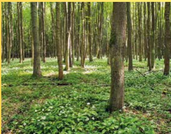
Diana, česnek medvědí.

Poznámka: Obuv a oblečení do terénu. Nezapomeňte svačinu!