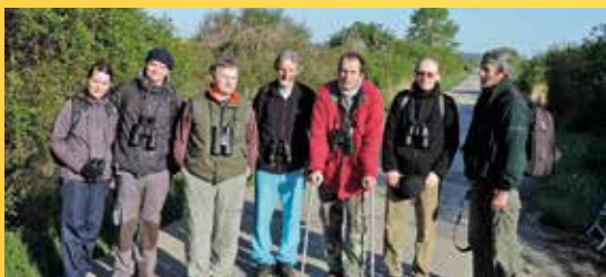
Vítání ptačího zpěvu v Horšovském Týně.

Poznámka: Podle počasí, ne moc barevné oblečení (zelená, šedá nebo hnědá barva je nejlepší). Dalekohled vítán.