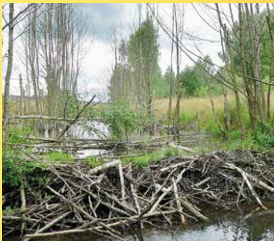
Bobří hráz.

Poznámka: Náročný terén, překážky a voda. Kdo nechce mít mokré nohy a zabláčené boty, ten se bez holínek neobejde. Konec exkurze bude směřován k odjezdu autobusu ve 12:08.