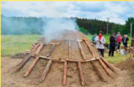
Den Českého lesa 2015, milíř.

Poznámka: Pro upřesnění informací sledujte www.ceskyles.ochranaprirody.cz nebo http://www.dumprirody.cz/dum-prirody-ceskeho-lesa/ .