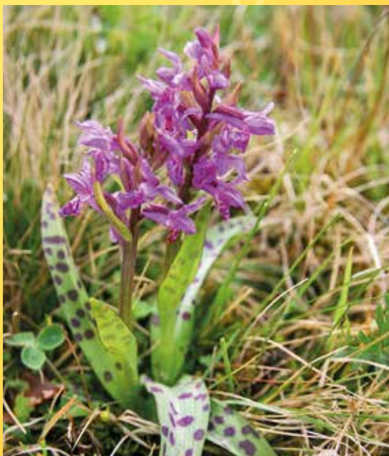
Prstnatec májový.

Poznámka: Obuv a oblečení do terénu, ideální holinky.