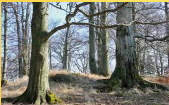
Bukový les.