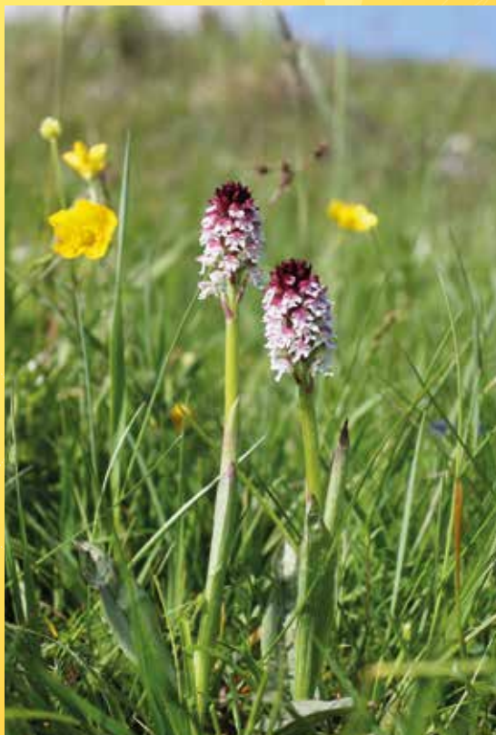
Michalovy Hory, vstavač osmahlý.

Poznámka: Je vhodné mít pevnou obuv a oblečení do terénu (dle počasí přizpůsobit), také přibalit si pořádnou svačinu a dostatek tekutin (lze dočepovat minerálku na cestě). Baterka vítána.