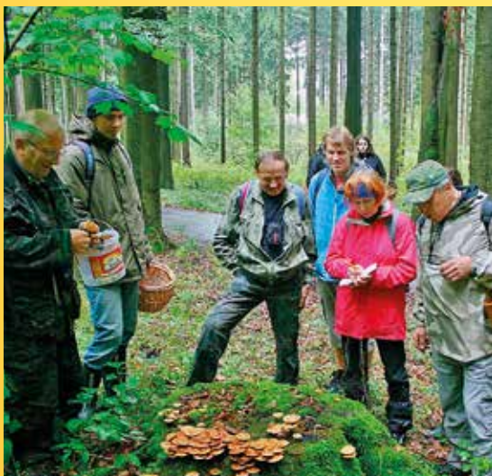
Mapování hub před výstavou.