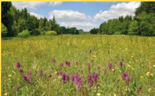
To nejceněnější z přírody Slavkovského lesa.

Ideální pro vážnější zájemce o přírodu (nutné se předem objednat od 30. 5. do 17. 6. na evamartinkova2@gmail.com kvůli místu v autobuse). Dále jsou nutné sebou holinky, případně jiná obuv, ve které lze chodit, i když bude celý den mokrá. Nezapomeňte si svačinu a dobrou náladu.