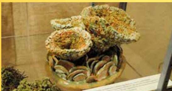
Keramický model lišejníku.

K dispozici jsou pracovní listy pro ZŠ. Od 19. 8. do 30. 10. 2016 bude tato putovní výstava k vidění v Muzeu Cheb.