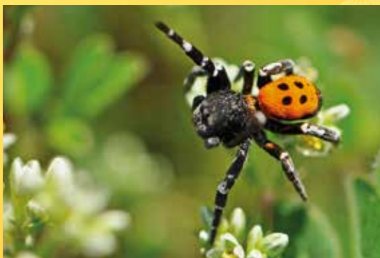
NPR Úhošť, stepník černonohý.