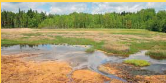
Národní přírodní rezervace Soos.