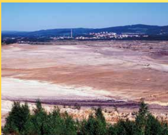
Lom Medard v roce 2000.