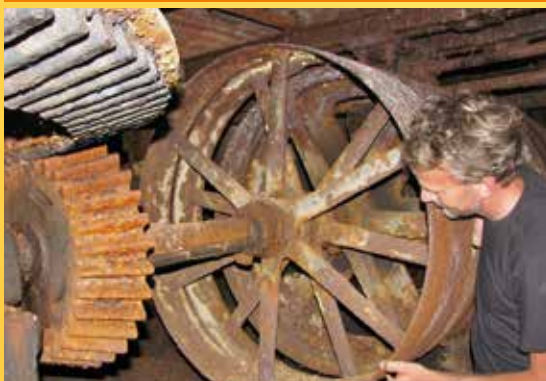
Unikátní dochované soustrojí v podzemí Arnoštovy leštírny.