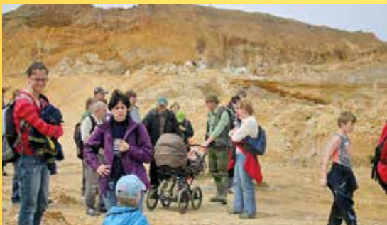
Z exkurze na obojživelníky do pískovny, 25. 4. 2015, Dřenice.