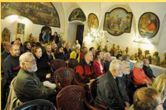
Setkání příznivců Českého lesa.