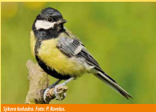
Sýkora koňadra.

Poznámka: Teplé oblečení a voděodolná obuv. Dalekohled a literatura k určování ptáků vítána.