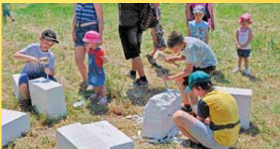
Den Českého lesa 2015.