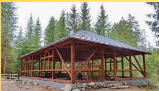
Arnoštova leštárna.

Poznámka: Obuv a oblečení vhodné do terénu. Čas vycházky bude přizpůsoben příjezdu a odjezdu cyklobusu.