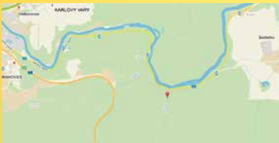
Orientační mapa místa konání akce.