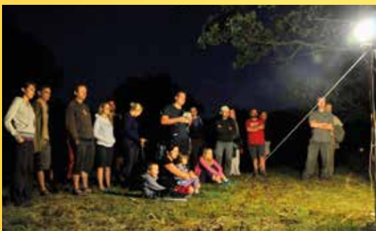
Můří noc v Americké zahradě, 2015.

Poznámka: Při čekání na setmění bude pro zájemce možná procházka po Naučné stezce Capartické louky s botaničkou Mgr. Markétou Kašparovou. Teplé oblečení a obuv do terénu.