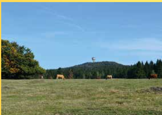
Pohled na Zvon.