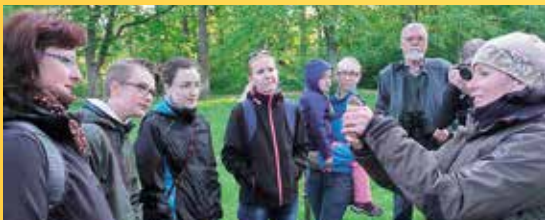
Vítání ptačího zpěvu v Tachově v roce 2015.