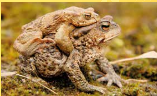
Páření ropuchy obecné.

Poznámka: Obuv a oblečení do terénu. Nezapomeňte svačinu.