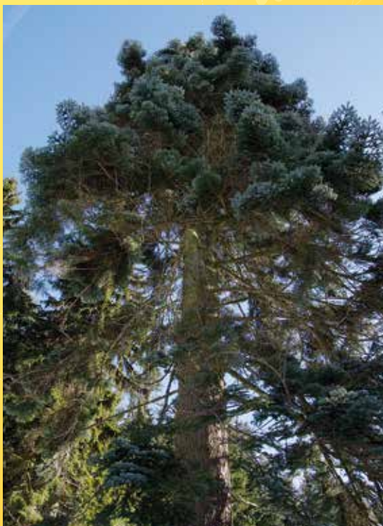
Jedle vznešená na Kladské u č. p. 5.

Poznámka: Pevná obuv a oblečení vhodné i do mokrého terénu, svačina, fotoaparát. Pokud budou mít všichni zajištěný odvoz a bude dobré počasí, počítáme s pozdějším návratem – cca 16:00 na Kladské, případně i s tamní hospodou na závěr.