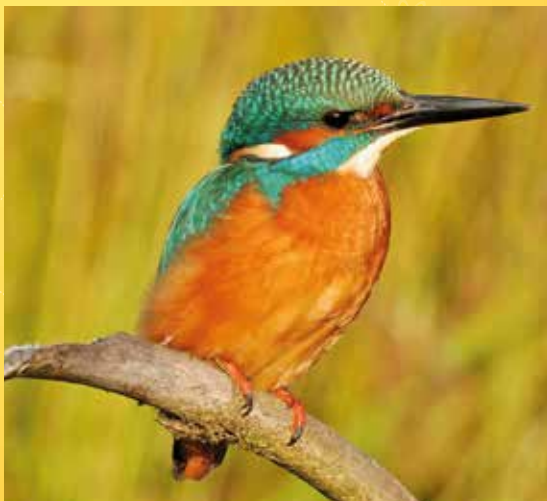
Ledňáček říční.

Poznámka: Obuv a oblečení do terénu, dalekohled vítán.