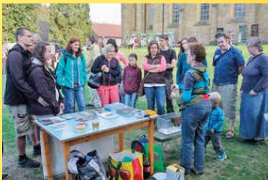
Netopýří noc v Kladruzech.