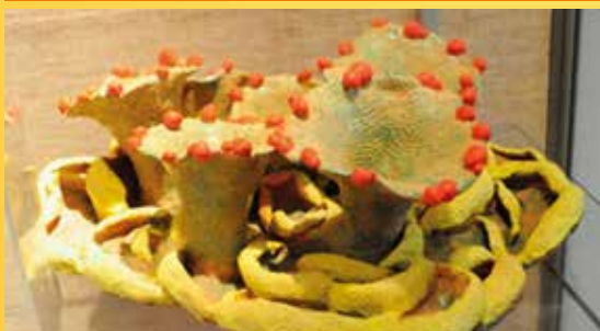
Keramický model lišejníku.