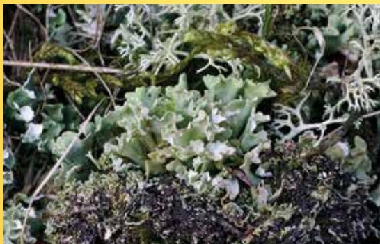
Vzácná dutohlávka Cladonia turgida.

Poznámka: Vhodné oblečení a obuv do terénu, případně psací potřeby, papírové obálky a tašku na vzorky.