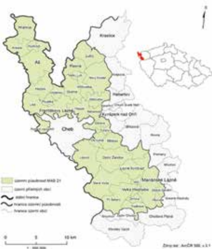
Vymezení územní působnosti

Strategie MAS 21 je zaměřena na zapojení do 3 operačních programů – Integrovaného regionálního operačního programu (IROP), Operačního programu Zaměstnanost 2014 – 2020 (OP Z) a Programu rozvoje venkova 2014 – 2020 (PRV).