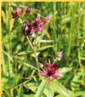
Mochna bahenní.