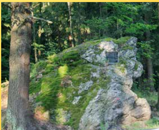
Goethův kámen mezi Aší a Hazlovem.