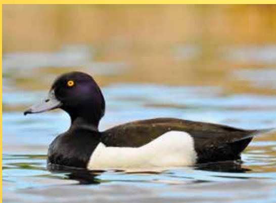
Festival ptactva, polák chocholačka.