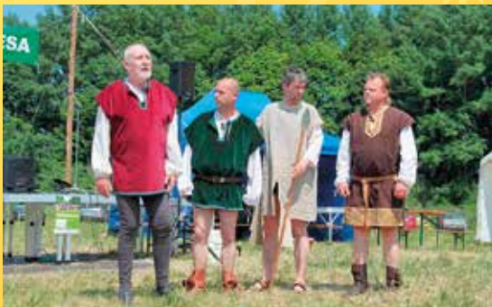
Den Českého lesa 2015, vystoupení tachovských Komediantů.