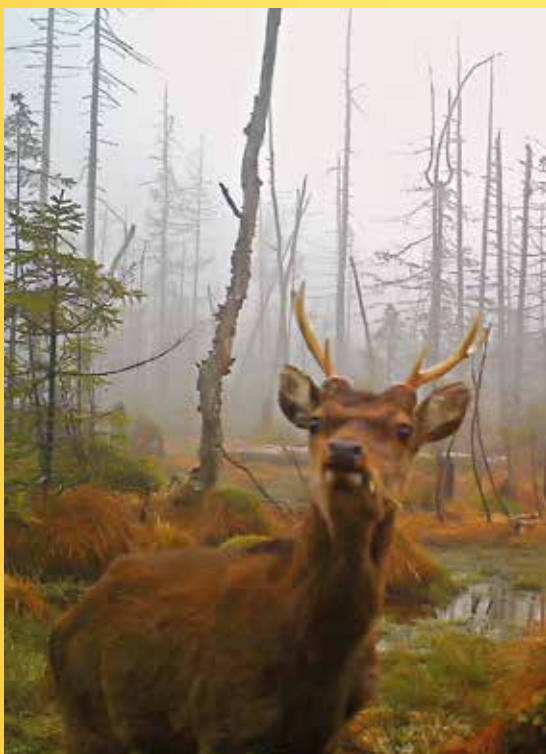
Jelen evropský v NPR Kladské rašeliny.

Poznámka: Nutné oblečení a obuv do terénu (v noci už bývá dost chladno).