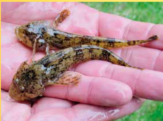
Vranka obecná.

Poznámka: Nezapomeňte na plavky, sítky, škeblouky, případně holinky a hlavně na dobrou náladu!