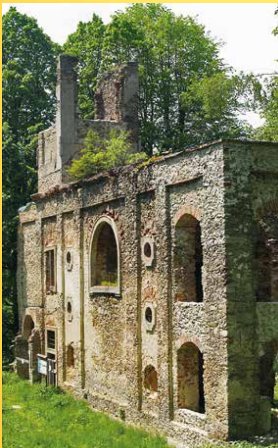
Svatá Apolena.

Poznámka: Obuv a oblečení vhodné do terénu.