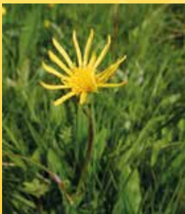
Hadí mord nízký.

Poznámka: Obuv a oblečení do terénu (půjde se i vlhčími biotopy). Nezapomňte svačinu! Po vycházce je možnost zúčastnit se „Můří noci“ v Caparticích.