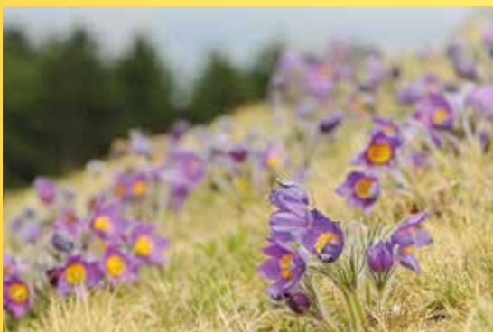
Zvoníčkov, koniklec otevřený.