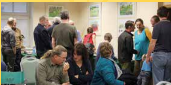
Setkání příznivců Slavkovského lesa v roce 2015.