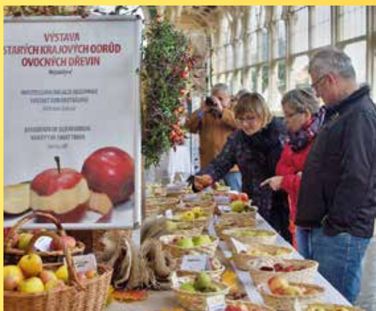
Lázeňský festival jablek v roce 2015.

Poznámka: Podrobný program bude včas upřesněn na www.slavkovskyles.ochranaprirody.cz .