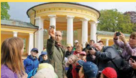
Vítání ptačího zpěvu v Mariánských Lázních.