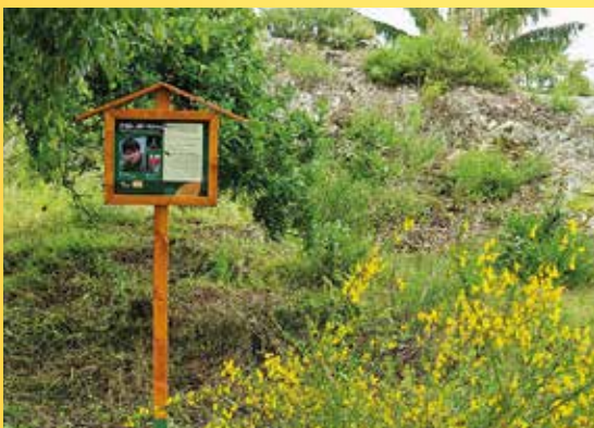
Vyhlídkový bod PP Chodovské skály.