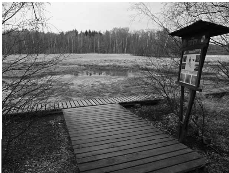
Naučné stezky – oblíbené cíle pro turistické výlety i poznávání (PR SOOS)

pořádá: KČT Union Cheb trasy: PT 5 a 10 km start: Integrovaná střední škola, Komenského 29, Cheb od 17 do 19 hodin cíl: Integrovaná střední škola, Komenského 29, Cheb do 22 hodin informace: Vít Lodr, Příkopní 11, 350 02 Cheb, mobil 736 754 156, e-mail: vitlodr@seznam.cz