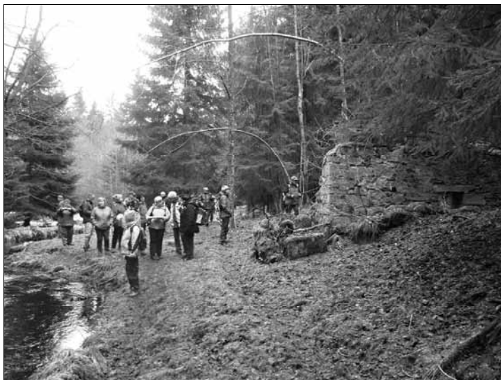
Z jarního putování za starými mlýny na Lobežském potoce (Sokolovsko)