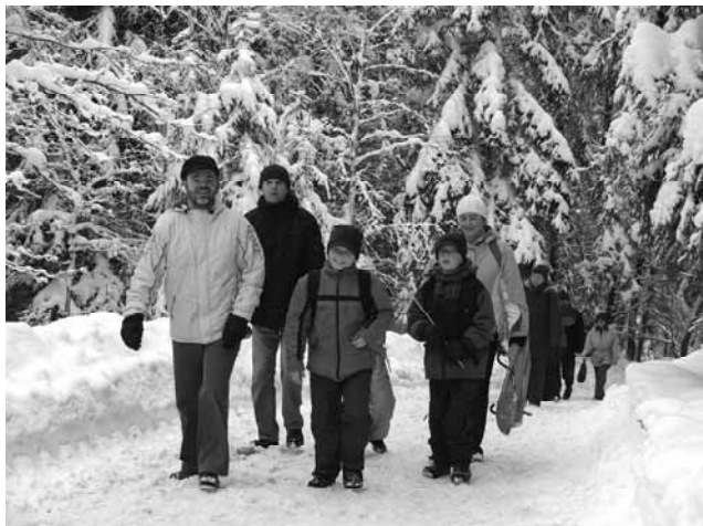
Pojďte také s námi 1. ledna na Zelenou horu (Novoroční čtyřlístek)

Pořadatelé na této akci nevybírají startovné, ale všichni účastníci hned na startu odevzdávají do zvláštních pokladniček dobrovolný příspěvek, minimálně však 20 Kč.