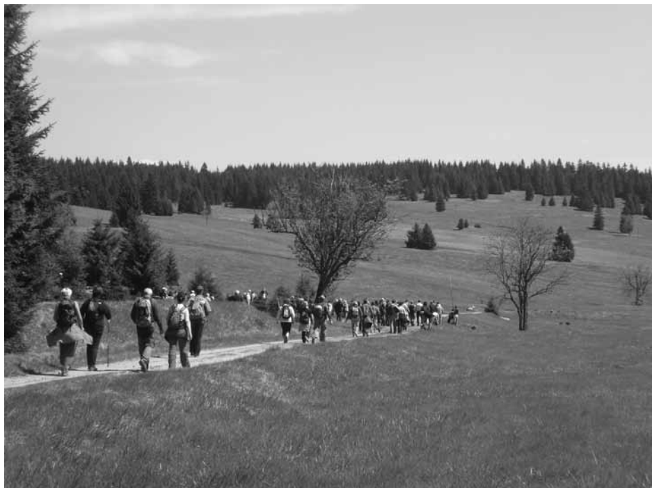
Za poznáním do okolí Přebuzí (býv. Chaloupky)