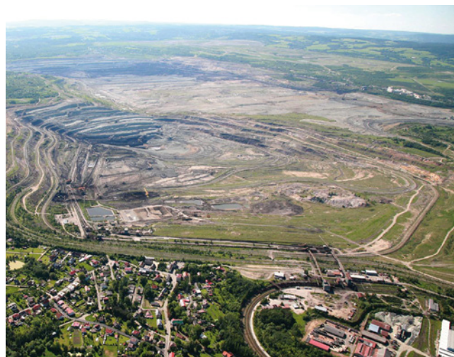
Důl Družba a Jiří a návrhy projektů v masterplanu

plánovací dokumentace, popř. rovnou realizovány. Autor masterplanu Ing. Martínek upozornil: „Největší výhodou Sokolovska je možnost zásadně ovlivňovat jeho utváření při procesu utlumování těžby uhlí. Vizi těchto změn jsme společně stanovili takto: Sokolovsko 2030 – průmyslové a rekreační centrum Karlovarského kraje za podpory odborného vzdělávání a vytváření podmínek pro schopné.“