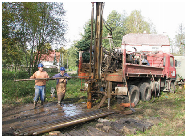
Průzkumný vrt HDR1

Cílem studie bylo prozkoumat možnosti využití důlní vody k vytápění budov v Dolním Rychnově. Průzkumný vrt v Revoluční ulici poblíž Rychnovského potoka však narazil na mimořádně nepropustné podloží, jež vydalo pouze 0,33 l/s, tj. 28,5 m 3 /den vody, jež při využití teplotního spádu 10°C/2°C umožní získat 11 kW tepelného výkonu. Jinde však lze uvažovat o řádově vyšší vydatnosti. Dále byly pořízeny projektové dokumentace na vytápění obecních budov pomocí tepelných čerpadel a návrh na geotermální elektrárnu pro průmyslovou zónu.