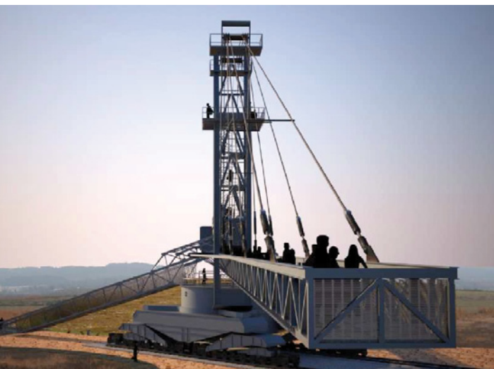
Chodov, Smolnická výsypka u Bílé vody