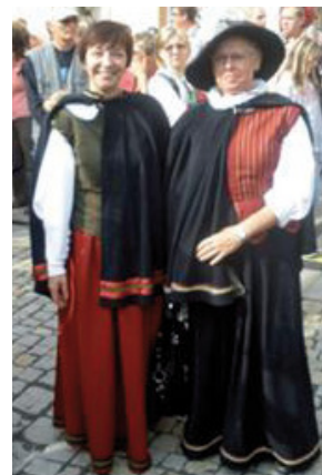
Setkání hornických měst a obcí České republiky: starostové a starostky v krojích.