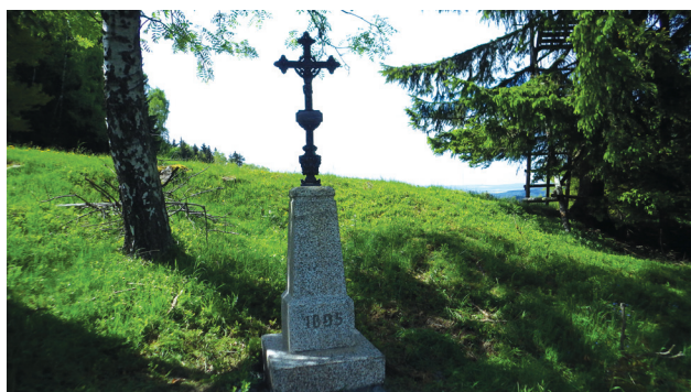
Opraveno Lesy ČR v květnu 2015