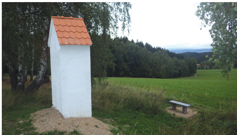
Kaplička na Studánce

Lesy České republiky, s. p., Lesní závod Kladská začal v tomto roce na svěřených pozemcích reali-