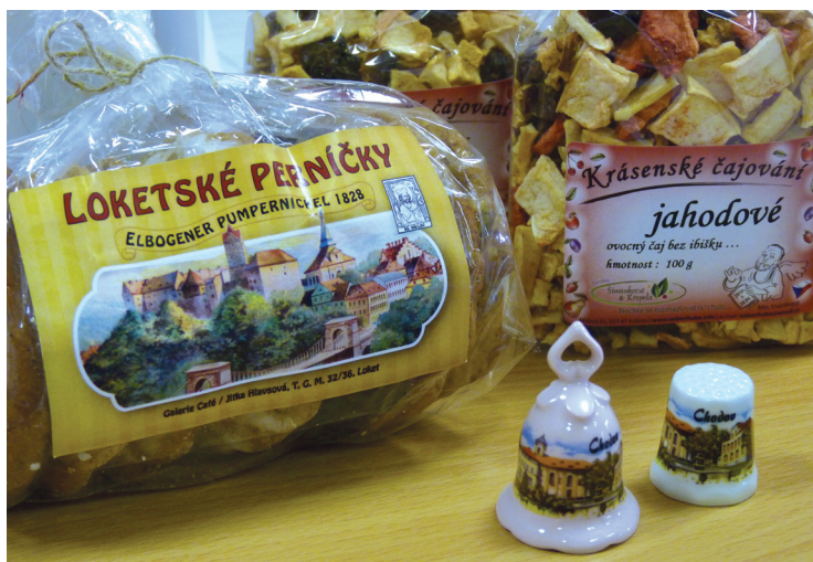
Certifikované produkty v r. 2015

Na jaře 2016 proběhne 3. ročník certifikací značky „Original product of Sokolovsko“. Pokud výrobci splní podmínky oprávněnosti jak pro výrobce, tak i pro výrobek a požádají v termínu o udělení značky, žádost posoudí certifikační komise. Získají-li min. 10 bodů za jedinečnost, komise jim udělí certifikát, tzn. právo užívání značky „Original product of Sokolovsko“.