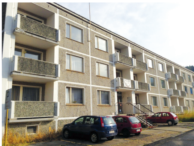
Kontaktní místo v Kraslicích sídlí ve stejné budově jako Úřad práce

Kancelář kontaktního místa v Jáchymově sídlí v objektu Farního sboru Českobratrské církve evangelické v Mincovní ulici č. p. 681. Kancelář je otevřená v pondělí od 15 do 17 hodin a ve čtvrtek od 8 do 10 hodin.