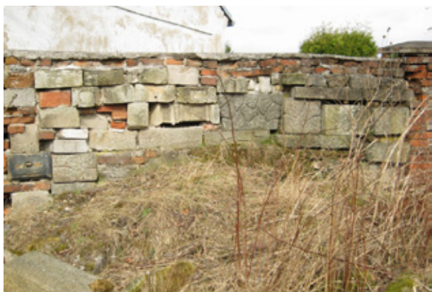
Stav před realizací:

né statické problémy na dalších dvou polích, proto byly strženy a vyzděny nově. Bylo zjištěno, že dlouholetým zatékáním vody je stav zdiva ještě v několika místech horší než se předpokládalo, je tedy možné, že bude muset být stržen větší počet polí, než bylo plánováno. V místech kde bylo zdivo v přijatelném stavu, byly odstraněny zbytky omítek a zdivo omítnuto.