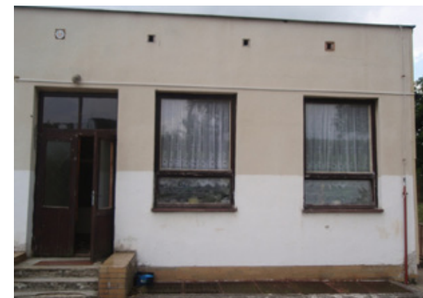
Stav objektu před rekonstrukcí:

Vzhledem k nastalým skutečnostem, bude ze strany obce podána žádost o prodloužení termínu k podání žádosti o proplacení, protože dříve stanovený termín nebude možno z objektivních důvodů dodržet.