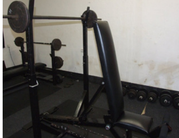
Stav před rekonstrukcí:

Popis průběhu realizace projektu :Během měsíce dubna byly zahájeny práce na úpravách místností, do kterých bude umístěn nábytek a zařízení, které jsou předmětem projektu Víceúčelová klubovna. Ve stávající posilovně bylo nutné opravit vlhké stěny a udělat novou podlahu, protože nově zakoupené posilovací stroje musí stát na pevném a rovném povrchu. Omítky byly obourány až na cihlu a poté byla nanasena nová vrstva sanační omítky. Podlaha byla vybudována zcela nová- betonová. Tyto práce nebyly předmětem projektu a byly udělány, mimo odborných věcí, občany obce Kaceřov a Horní Pochlovice zdarma. Počet zdarma odpracovaných hodin se blíží počtu 500 s tím, že se na opravách podílelo cca 15 občanů. Byly zakoupeny nové posilovací stroje a jiné pomůcky pro posilování. Dnes posilovnu navštěvuje 25 občanů a neustále přibývá nových. Díky tomuto projektu se zájem o návštěvu posilovny zvýšil, hlavně mezi mladými lidmi do 25 let a také posilovnu nově navštěvují i dívky.