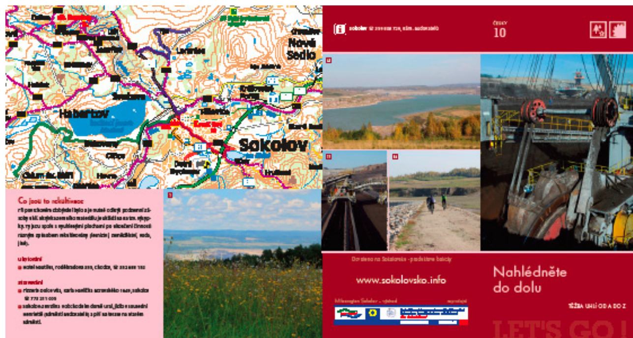
Leták Nahlédněte do dolu

tipy na ubytování a stravování. Témat je dvacet: cyklotrasy, vodácká pohádka, golfový požitek, podivuhodná krajina, středověk a lázeňská noblesa atd. K letákům náleží velká mapa Sokolovska. Letáky i mapa jsou k dispozici v češtině, němčině a angličtině. Do infocenter budou distribuovány v lednu 2011.