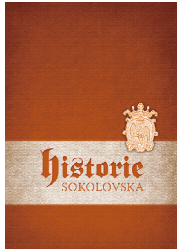
Titulní strana Historie Sokolovska

Produktové balíčky jsou balíčky služeb, které si můžeme koupit... a tím by naše starosti se zajištěním dovolené měly skončit. Balíčky obsahují nejen ubytování a stravování, ale také zážitek, třeba lezení po skalách s instruktorem nebo týdenní léčebnou kúru v lázních. Balíčky mikroregionu však využívají trochu jinou podobu balíčků, a to neziskovou. Jde o návod na výbornou dovolenou, výlet či zážitek. Návštěvník si v infocentru vezme balíček (tj. leták), kde najde výběr toho nejlepšího z oblasti. Na každém letáku je popis trasy, možné odbočky, seznam zajímavostí, mapa,