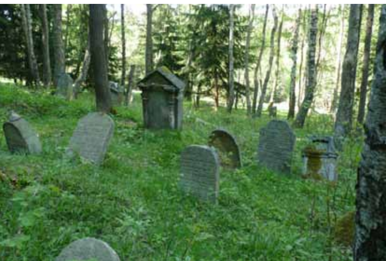
Židovský hřbitov u Krásné Lípy

Protože ne všem je lhostejná minulost území, kde dnes žijí, je v současné době realizován projekt „Obnova reliktů zaniklých obcí Slavkovského lesa“, jehož nositelem je MAS Sokolovsko o.p.s. Tento projekt je spolufinancován z programu ROP Severozápad, opatření 2.1 Budování kapacity pro místní rozvoj, informovanost a osvětu veřejnosti. Jeho celkové výdaje odhadujeme na 2,3 mil. Kč. Jedná se o další etapu využití potenciálu zaniklých obcí pro rozvoj cestovního ruchu a přímo navazuje na projekt města Březová „Využití fenoménu zaniklých obcí pro rozvoj CR - I. etapa“.