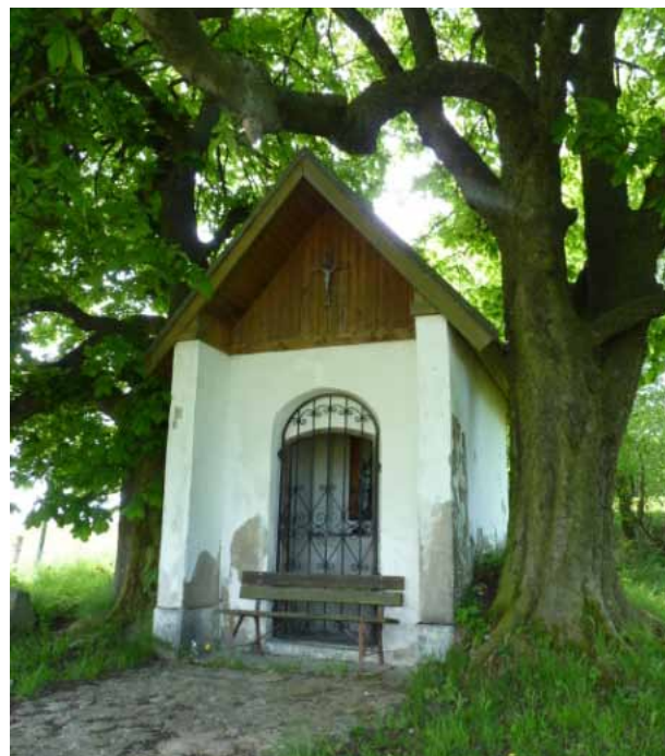
Kaple Panny Marie Sněžné u Krásna