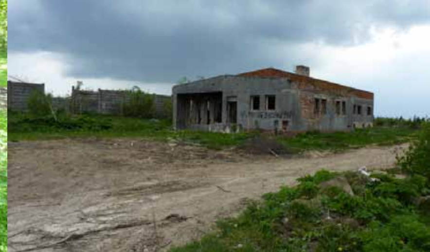
Objekty bývalé raketové základny na vrcholu Pod Skalkou.

Je velkou snahou starostů měst a obcí zaniklé obce připomínat budoucím generacím, ale i vrátit do některých částečně zanikajících obcí život. Pro zachování místního rázu vesnice je třeba chránit a udržovat historické památky, zachovávat lidové tradice a původní architekturu a v neposlední řadě zvyšovat povědomí o přírodních a kulturních hodnotách prostředí, jejich obnově a rehabilitaci.