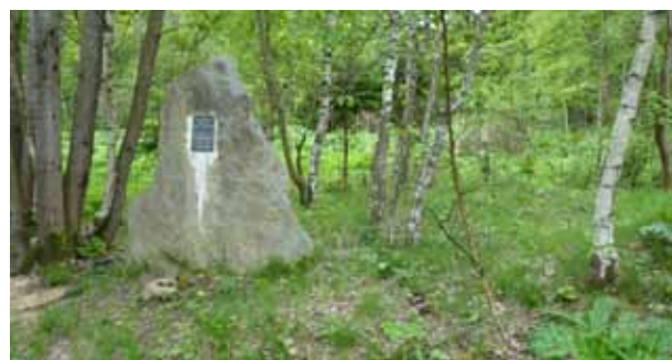
Památník u silnice v místech zaniklé obce Smrkovec