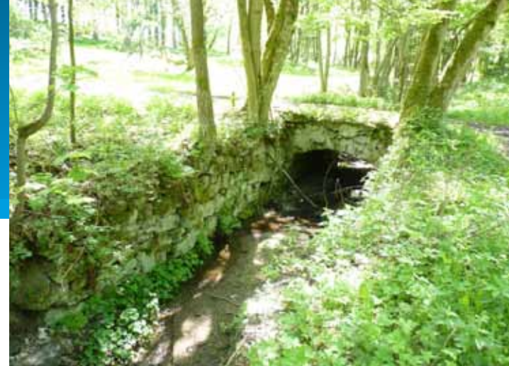
Stavitelské umění předků, kamenný můstek nad potokem Velká Libava v místech zaniklé obce Smrkovec.

Cílem tohoto projektu je zmapování reliktů (pozůstatků) po zaniklých obcích na území CHKO Slavkovský les. Pozůstatky po předcích jsou roztroušeny nejen v místech bývalých obcí, ale lze je nalézt i mimo tato centra. Mezi relikty řadíme mj. pozůstatky různých stavebních objektů, kříže a pomníky, hřbitovy, boží muka, ale i pomalu zarůstající sady a vzrostlé aleje. „Nejmladším“ reliktem Slavkovského lesa jsou v současné době pozůstatky protivzdušné obrany raketové základny na vrcholu „Pod Skalkou“. Dnes tato zcela „vybydlená“ základna slouží jako herní prostor pro využití milovníků různých bojových her. Na území MAS Sokolovsko lze nalézt pozůstatky zcela zaniklých obcí, jinde obec či osadu připomíná pomalu se rozpadající a zarůstající kříž či pomník. Relikty lze nalézt i v částečně zaniklých obcích, kde zbývá jen pár objektů, převážně využívaných pro rekreaci.