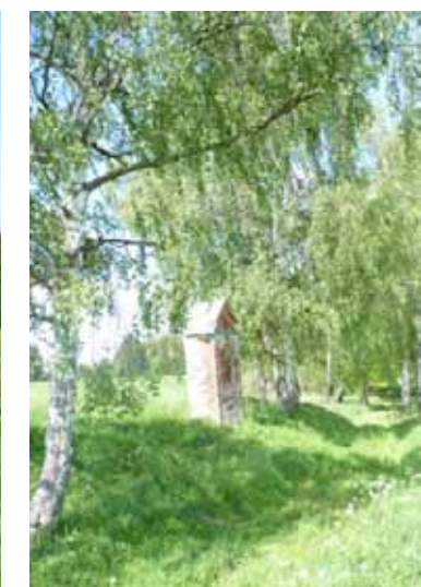
Boží muka nad zaniklou obcí Studánka