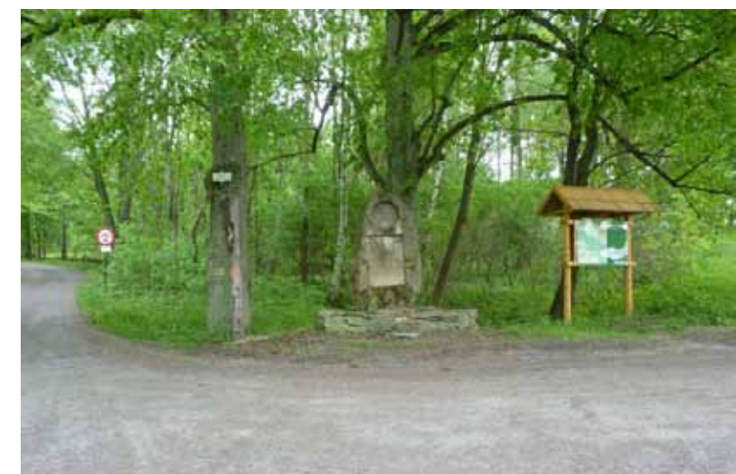
Pomník a informační tabule o zaniklé obci Studánka