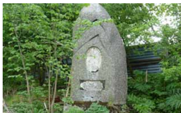
Pomník v zaniklé obci Horní Žitná